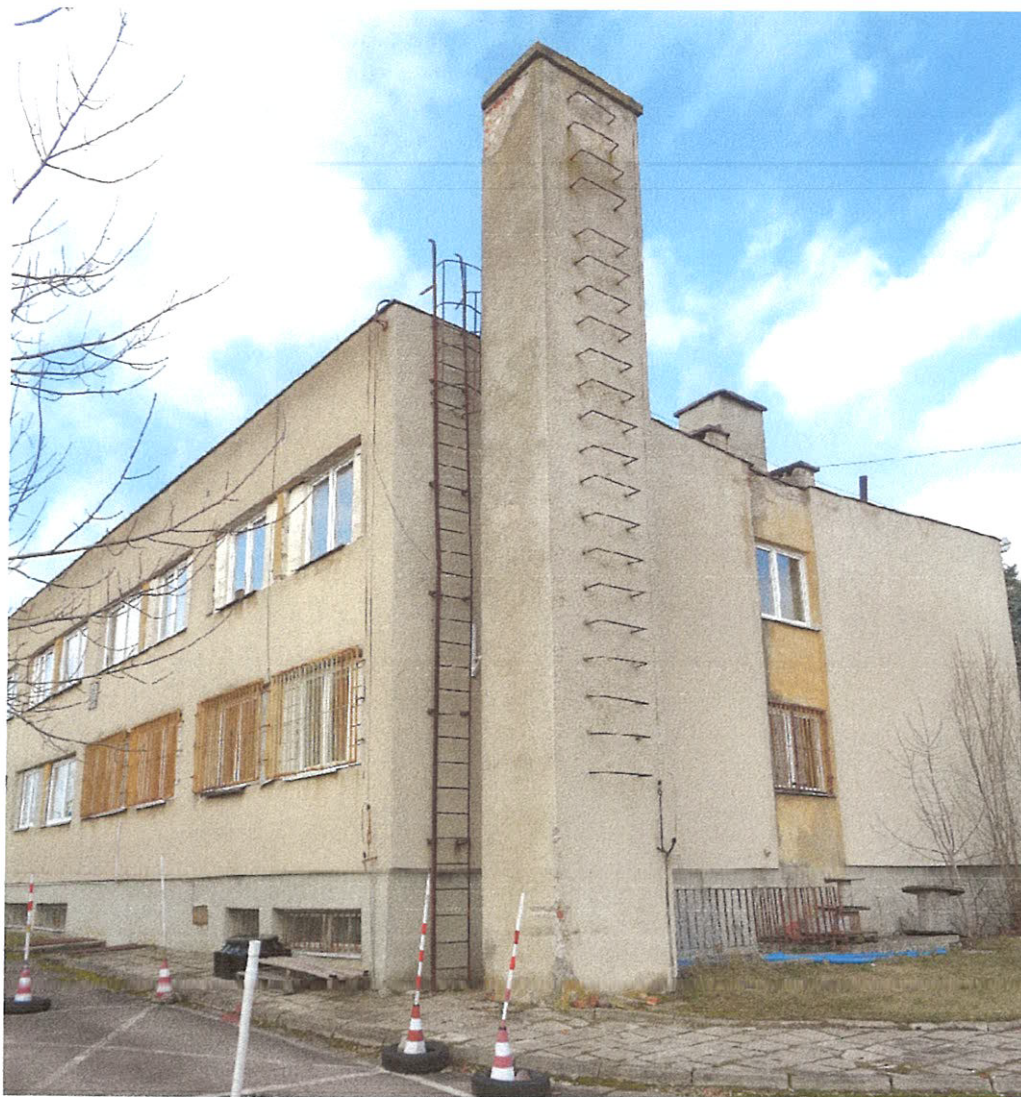
Fot. 1. Widok komina