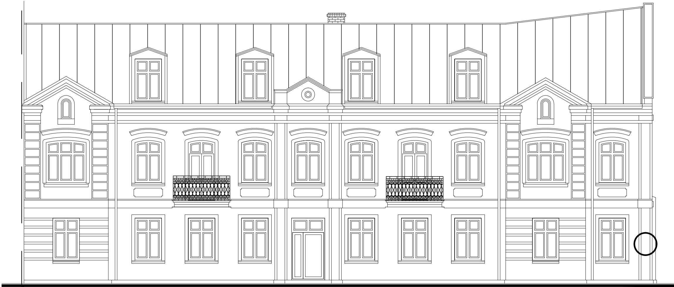
A. ELEWACJA WSCHODNIA /FRONTOWA/ 1:100

UWAGA: ZE WZGLEDU NA NIEDOKŁADNOŚCI DANYCH INWENTARYZOWANYCH ORAZ BRAK PEŁNEGO DOSTĘPU W ZAKRESIE BUDYNKU INWENTARYZOWANEGO WYMIARY (GABARYTY) UJĘTE W OPRACOWANIU NALEŻY TRAKTOWAĆ JAKO PRZYBLIŻONE - SPRAWDZIĆ I USCISLIĆ W TRAKCIE REALIZACJI