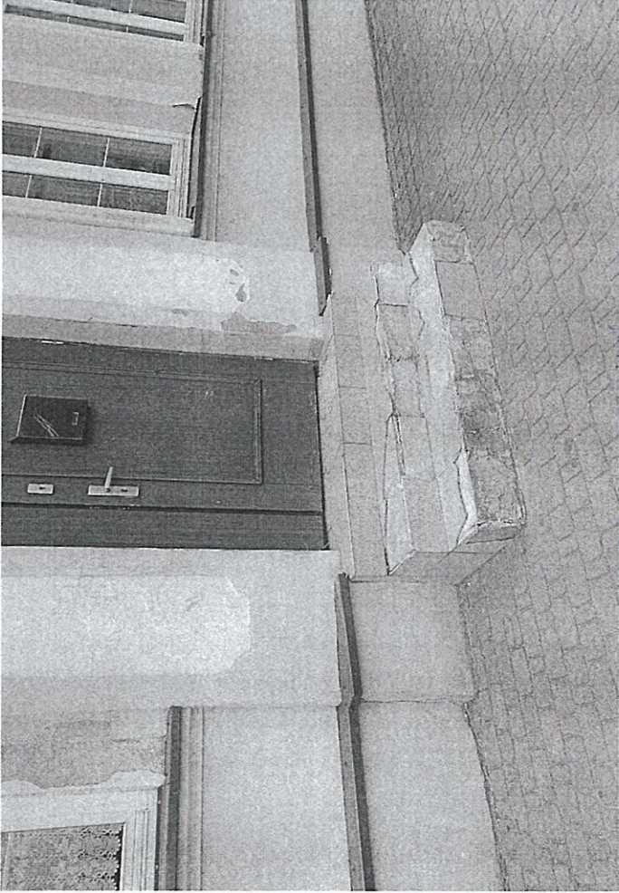
Wesola 30 - I wejście do budynku